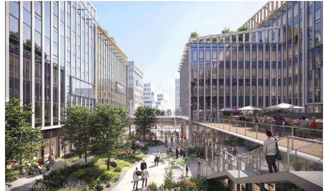
Bouygues Immobilier, ZC5-Tranche A, AXA IM Alts et Bouygues Immobilier, HAMØ

Les nouvelles opérations bas carbone exemplaires de l'année de tous types, partout en France ainsi que le Palmarès des maîtres d'ouvrage les plus engagés de l'année seront dévoilés : des modèles pour la profession.