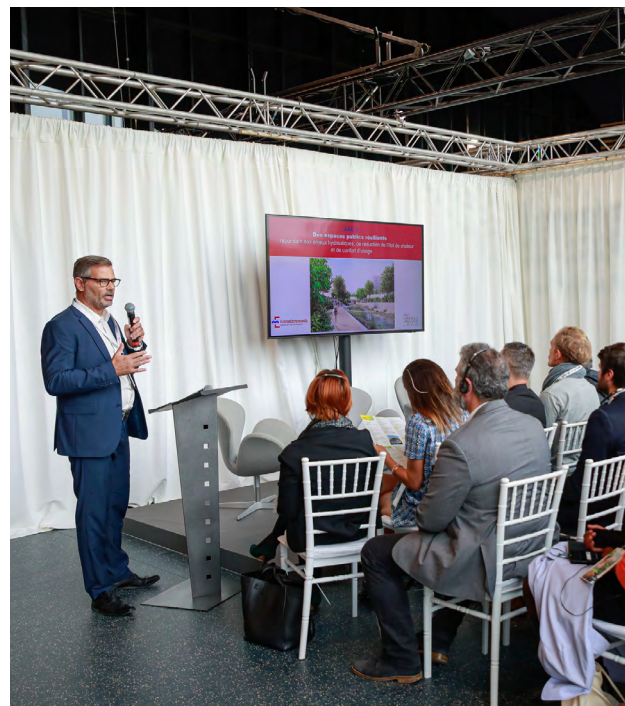
Conférence du vendredi 23 septembre 2022 : Métropole Aix-Marseille-Provence Euroméditerranée