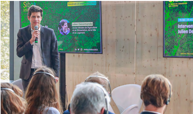
SIBCA 2022 : Keynote de Julien Denormandie